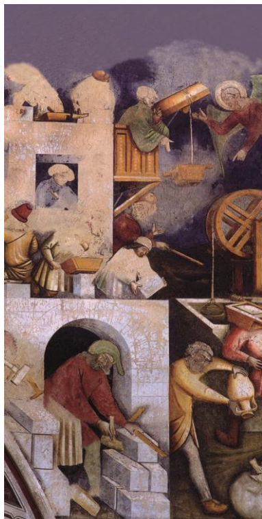
Détail d'une fresque dans l'église S. Catarina (Galatina, Pouilles, Italie)